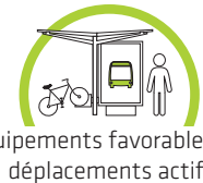
Équipements favorables aux déplacements actifs